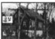
Gårdsbilder sammenstilt med personbilder