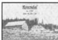
Gårdsbilder med informasjon