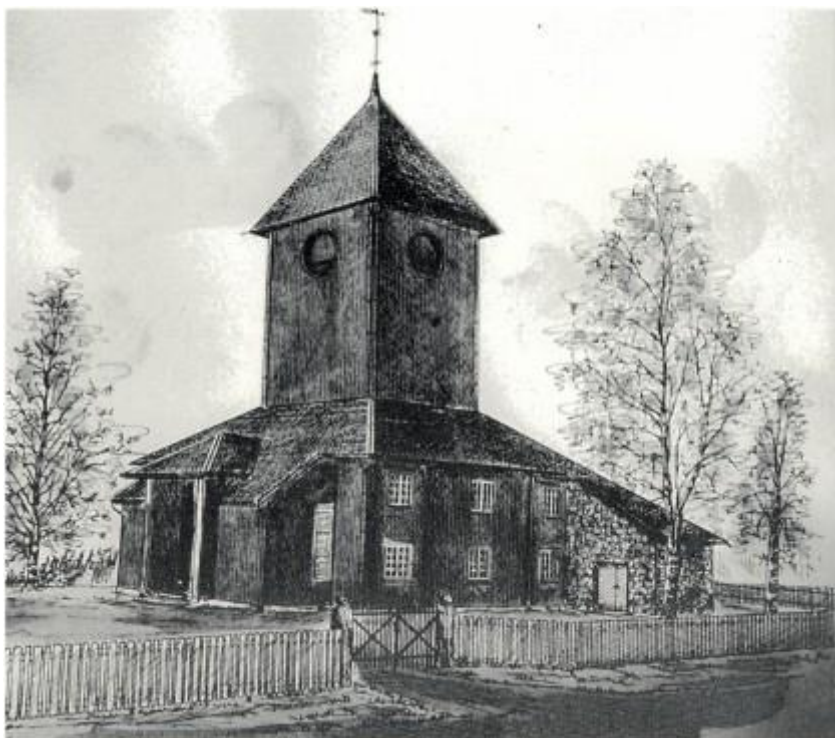
Ål kirke i Gran, tegnet i 1978 av I. Andresen. Se artikkel side 49.

Nr. 1 1997 Årgang 15 Pris kr. 40,- ISSN: 0802-860